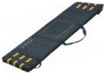
Bolsa de transporte